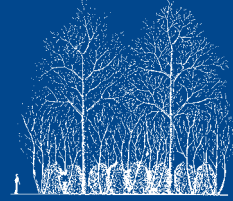
6 à 7 m