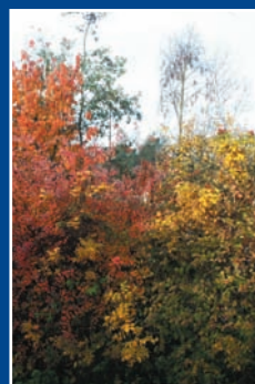
Haie fleurie à l'automne