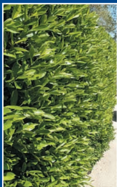
Haie Laurier palme rotundifolia

Kit pour 10 m sur 2 lignes (20 arbustes) - 1 m entre plants sur la ligne. - 0,50 m entre les 2 lignes.