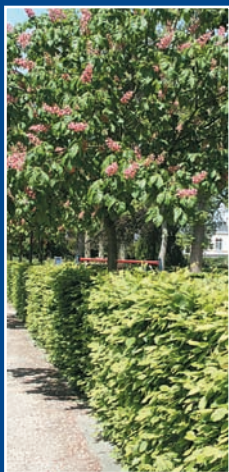
Haie Charmille et marronnier rouge