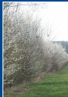
Haie champêtre floraison début printemps

Le coût du transport à domicile vous sera donné sur simple appel téléphonique. Il est fonction du nombre de kits et du département de destination des colis.