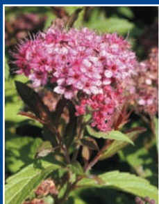
Spirée Bumalda «Anthony Waterer»